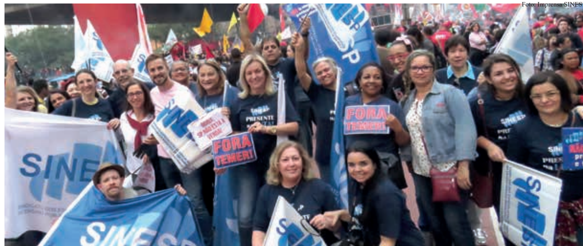
No dia 30 de junho, o SINESP convocou os Gestores e Gestoras Educacionais para o ato na Av. Paulista