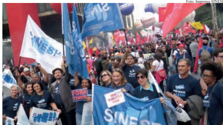
Dirigentes e filiados do SINESP em ato no dia 30 de junho na Av. Paulista

As novas regras impõem retrocesso histórico nos direitos trabalhistas. Concedem aos empre-