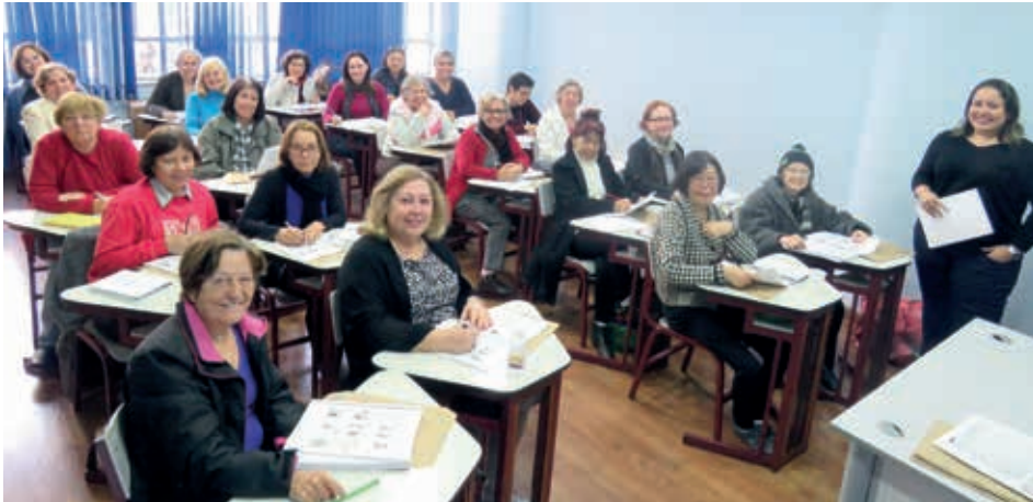
Turma do curso de férias de inglês básico para viagens

O CFCL-SINESP teve um mês de julho bastante agitado com a primeira experiência do Sindicato com cursos de férias. Inglês básico para viagens e fotografia no celular foram os cursos oferecidos, concluídos com plena satisfação dos filiados. O sucesso indica tratar-se de um projeto a ser continuado e reforçado pelo Sindicato.