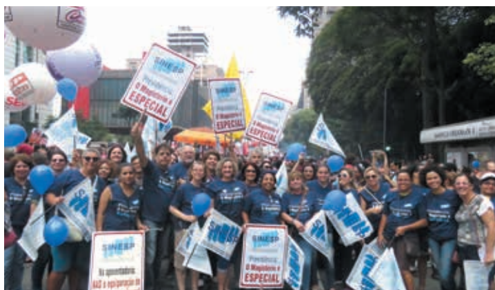
O SINESP e a categoria na luta unificada contra a reforma da Previdência