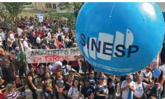
A GREVE de 2018 foi o ponto forte da nossa luta em defesa da Previdência