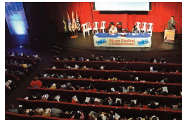
Fórum 2017 do SINESP debateu a luta contra a reforma