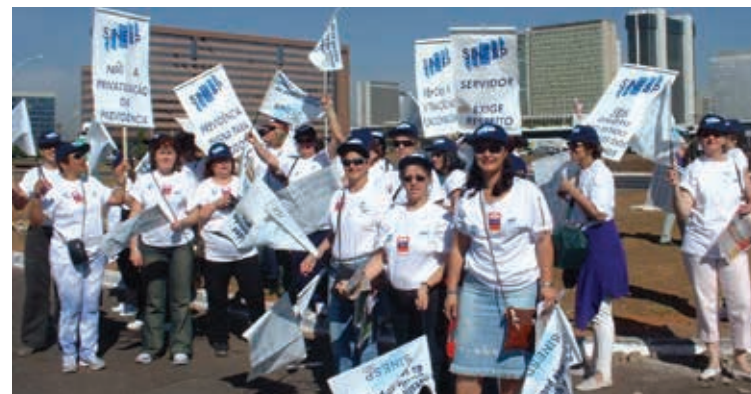
Caravana do SINESP em Brasília com Dirigentes, Conselheiros e RELTs, na luta contra a primeira reforma da Previdência, em 1998

Jornal nº 42 do SINESP, de outubro de 1999, apresenta debates do Fórum e mostra que a preocupação do SINESP vem desde os primeiros ataques à nossa aposentadoria!