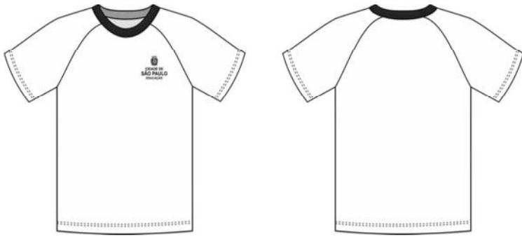
Figura 01 – Desenho ilustrativo