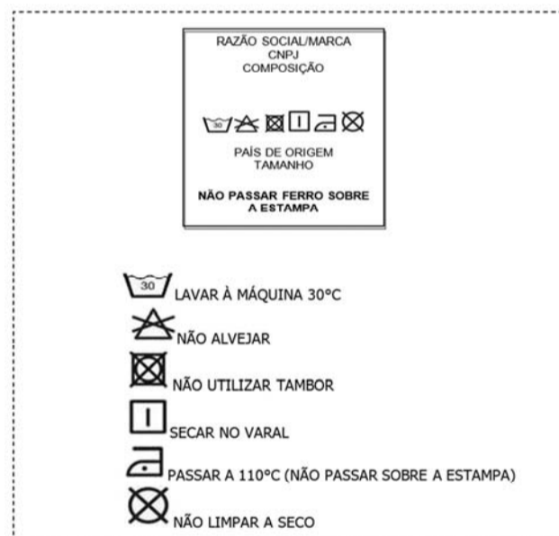
Figura 07 – Sugestão etiqueta

O produto deve ser devidamente dobrado e embalado individualmente em uma embalagem de plástico transparente no tamanho adequado ao produto e com a identificação do produto e tamanho.