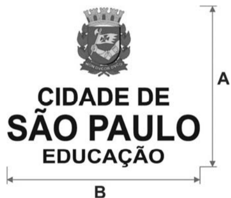
Figura 04 – Logotipo – indicação de medidas