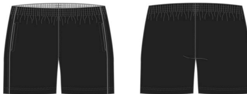
Figura 01 – Desenho ilustrativo