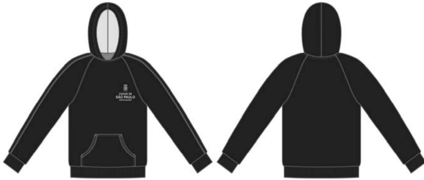
Figura 01 – Desenho ilustrativo