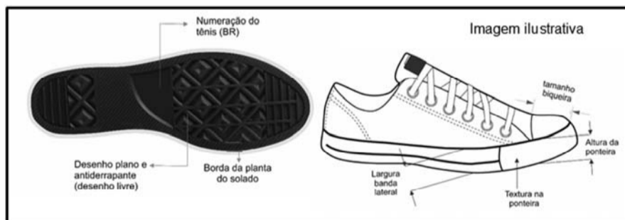
Figura 4 – Solado

O solado do tênis, de cor natural, é uma parte importante para estabilidade, amortecimento e durabilidade do calçado. Toda a especificação, quando refere-se ao solado e medidas lineares, serão mencionadas para o padrão de tamanho 35. O solado deverá ser em borracha em processo vulcanizado, em autoclave. Ainda na planta, deverá apresentar desenhos em relevo em praticamente toda a sua extensão, com possibilidade de exceção na região do enfranque. O material e o desenho da parte inferior (planta) devem proporcionar característica antiderrapante, tendo uma borda em torno (borda da planta do solado) com mínimo 5 mm de largura para melhor gripe. As bandas laterais (também em borracha) na cor branca deverão ter espessura de 2,0 mm (± 0,2 mm), além de altura de 28 mm (± 2 mm), o friso e filete na cor azul marinho (PANTONE 19-3920 TPX), a biqueira (na cor branca) ter espessura de 2 mm (± 0,2 mm) com tamanho da biqueira de 37 mm (± 2 mm) para não interferir no ponto de flexão, além da ponteira na cor azul marinho (PANTONE 19-3920 TPX) deverá ter espessura de 1,8 mm (± 0,2 mm) e altura de 28 mm (± 2mm).