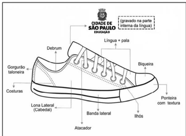
Figura 1 – Foto ilustrativa das partes do tênis

O tênis deverá ser confeccionado em lona de algodão dublada, com acabamento de borda do colarinho com debrum, conter ilhoses na vista para passagem do atacador, e a lingueta (língua) serem em peça única até altura da pala. O processo de montagem deverá ser com palmilha ensacada, (strobrel). O solado será fabricado através do processo de vulcanização em autoclave. A biqueira, ponteira, a banda lateral e o solado (planta de baixo) deverão ser de uma composição à base de borracha vulcanizada. No quadro abaixo, uma foto do produto (ilustrativa) para orientação das partes do tênis em questão.