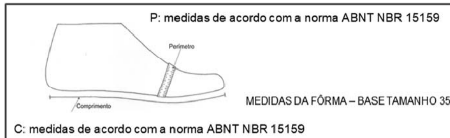
Figura 3 – Medidas da Fôrma

A fôrma feminina deverá conter as medidas mínimas indicadas na figura abaixo para o tamanho 35 (pé médio) (para demais tamanhos correr escala francesa, 6,66 mm por tamanho), a fim de proporcionar ótimo calce e conforto ao usuário.