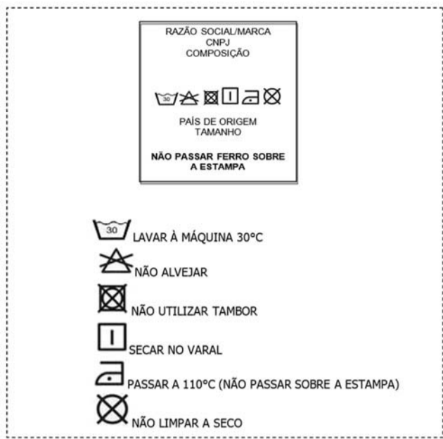
Figura 04 – Sugestão etiqueta