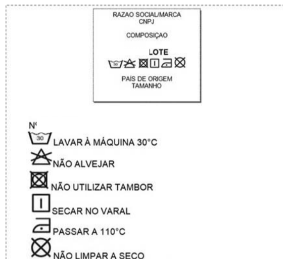
Figura 05 – Sugestão etiqueta

O produto deve ser devidamente dobrado e embalado individualmente em uma embalagem de plástico transparente no tamanho adequado ao produto e com a identificação do produto e tamanho.