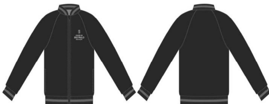
Figura 01 – Desenho ilustrativo da Jaqueta