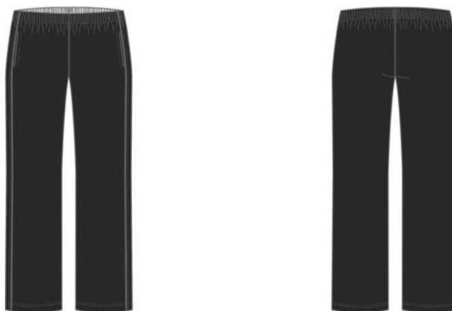
Figura 02 – Desenho ilustrativo da calça