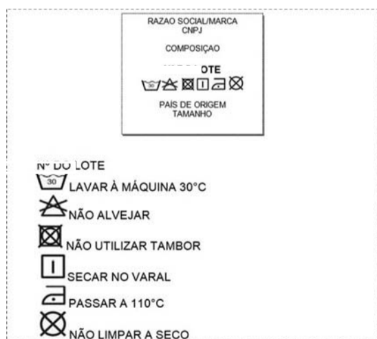
Figura 14 - Sugestão etiqueta

Os caracteres tipográficos dos indicativos na cor preta, devendo ser uniformes e informar a razão social, CNPJ, marca, composição do tecido, símbolos/instruções de lavagem, tamanho. As etiquetas devem cumprir as obrigações descritas no Regulamento Técnico Mercosul sobre Etiquetagem de Produtos Têxteis determinadas pelas Resoluções vigentes.