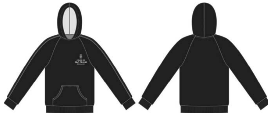
Figura 01 – Desenho ilustrativo